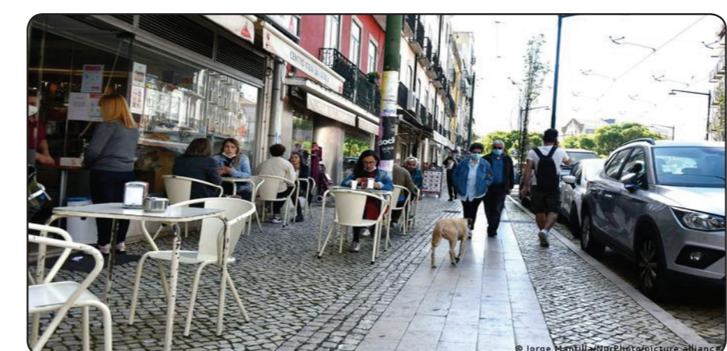
دفاتر منطقه‌ای سازمان صحت جهانی از ثبت بیش از یک میلیون مرگ در اروپا بیش از یک میلیون نفر جان خود را بر اثر کرونا یا در ارتباط با آن از دست داده اند بر اساس آمار گزارش داده است. بنا بر این آمار در حال حاضر هر هفته یک

سازمان جهانی صحت تاکنون در اروپا بیش از یک میلیون نفر جان خود را بر اثر کرونا یا در ارتباط با آن از دست داده اند. بنا بر این آمار در هفته حدود یک میلیون و ۶۰۰ هزار نفر دیگر به این بیماری مبتلا می‌شوند. هانس کلوگه، مدیر منطقه‌ای سازمان صحت جهانی روز پنجشنبه ۲۶ حمل در یک کنفرانس خبری که در آتن برگزار شد، گفت که معنای این آمار این است که هر ساعت ۹۵۰۰ نفر و هر دقیقه ۱۶۰ نفر بیمار جدید ثبت می‌شود. او این وضع را بسیار نگران کننده خواند. او همچنین گفت که از هنگام شروع واکسیناسیون در اروپا سرعت ابتلای افراد سالمند به این بیماری مقداری کاهش یافته است. در جغرافیای منطقه‌ای سازمان صحت جهانی ۵۰ کشور جزو کشورهای اروپایی به شمار می‌رود که شامل ترکیه، روسیه و اوکراین نیز می‌شود. در محدوده اقتصادی اروپا نیز کشورهای ناروی، ایسلند و لیشتن‌اشتان می‌گنجد که «سهاد سلامت اروپا» ۱۳۰ هزار مرگ بر اثر کرونا یا در ارتباط با کرونا در آنها ثبت کرده است. دولت آلمان قصد دارد محدودیت‌های بسیار شدیدی را برای مهار کرونا اعمال کند. این در حالی است که برخی کشورها، از جمله بریتانیا از شدت محدودیت‌های کرونایی کاسته‌اند.